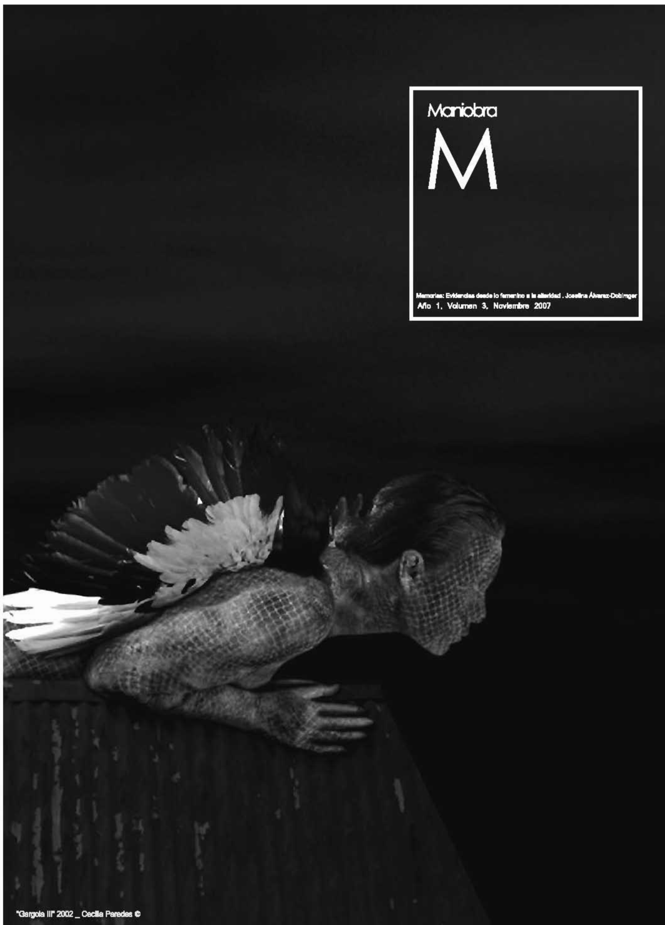
"Gangola III" 2002 - Cecilia Paredes ©